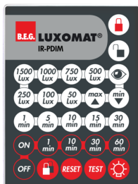
IR-PDim Č. zboží: 92200

Rozměry: 40 x 55 x 103 mm Barva materiál: černá Frekvence: 2.4 GHz ISM band, GFSK 0.2 dBm + 5.3 dBi = 5.5 dBm