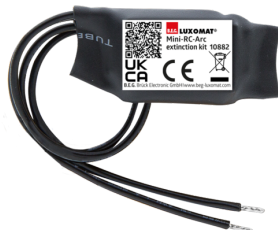
mini-odrušovací člen Č. zboží: 10882

Napětí: 230 V AC ±10% Rozměry: 38 x 12 x 26 mm Stupeň krytí: IP20 / třída II