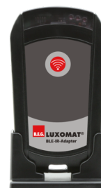
BLE-IR-adaptér Č. zboží: 93067

Napětí: 230 V AC ±10% Rozměry: 50 x 23 x 8 mm Stupeň krytí: IP20 / třída II