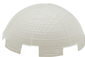
krycí lamela PD2-SM Č. zboží: 92260

Rozměry: Ø 200 x 90 mm Odolnost vůči rázu: IK09 Bydlení: lakovaný ocelový koš