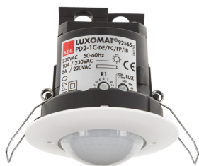
PD2-M-1C-FC Č. zboží: 92565

Pro získání sady podle technické specifikace objednejte uvedené položky.