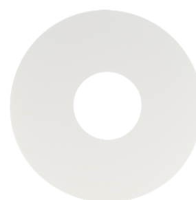
krycí kroužek PD11 Č. zboží: 92692

Rozměry: Ø 52 x 3 mm Bydlení: obal UV a nárazuvzdorný polykarbonát Barva materiál: černá, podobný RAL9005