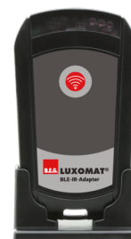
BLE-IR-adapter Č. zboží: 93067

Napětí: 230 V AC ±10% Rozměry: 50 x 23 x 8 mm Stupeň krytí: IP20 / třída II