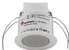
PD11-KNXs-FLAT-ST-FC Č. zboží: 93522

Pro získání sady podle technické specifikace objednejte uvedené položky.