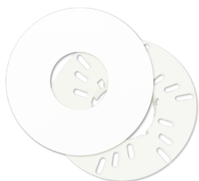
FM-adaptér set / PD11 Č. zboží: 92833

Napětí: z KNX-BUS-sítě Rozměry: Ø 52 x 48 mm Elektřina: 12 mA