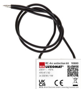
odrušovací člen Č. zboží: 10880

Napětí: 230 V AC \pm 10\% Rozměry: 38 x 12 x 26 mm Stupeň krytí: IP20 / třída II