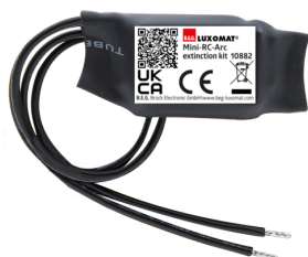
mini-odrušovací člen Č. zboží: 10882

Napětí: 230 V AC \pm 10\% Rozměry: 38 x 12 x 26 mm Stupeň krytí: IP20 / třída II