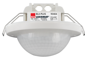
BL4-PLUS-FC Art.No: 93404

To receive the bundle according to the technical specification, please order the items listed.