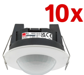
10 x BL2-FC Č. zboží: 93327

Pro získání sady podle technické specifikace objednejte uvedené položky.